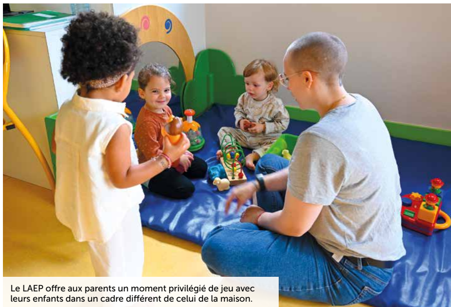
Le LAEP offre aux parents un moment privilégié de jeu avec leurs enfants dans un cadre différent de celui de la maison.

Ouvert tous les jeudis, hors vacances scolaires et jours fériés. Gratuit, sans inscription et anonyme.