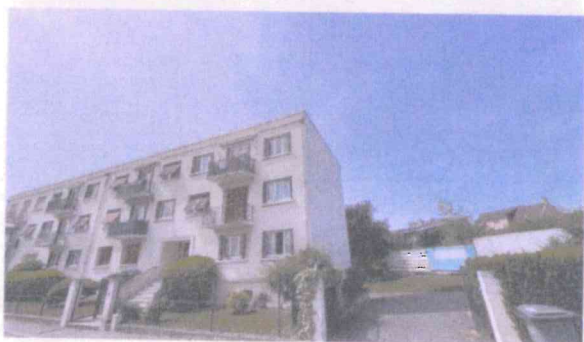
Vue immeuble, de la rue Léo Lagrange

Immeuble collectif 12 Logements R + 2 + s/sol soit une hauteur d'environ 10 Mètres