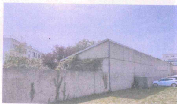
Vue immeuble, de la parcelle AC 143