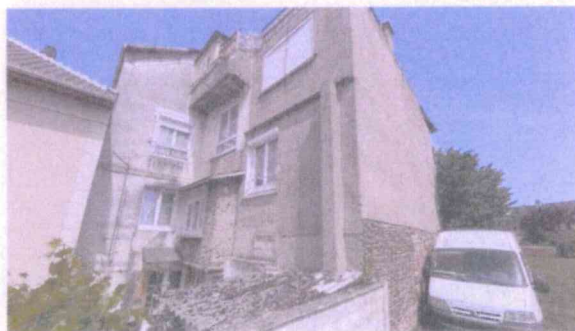
Vue immeuble, de la parcelle AC 143