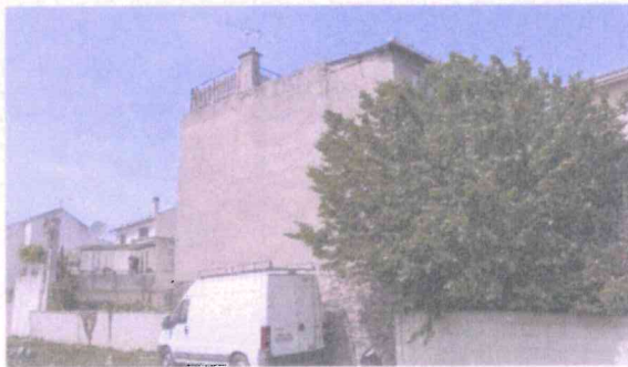
Vue immeuble, de la parcelle AC 143