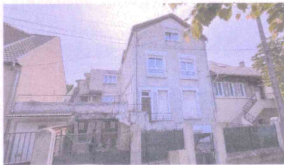
Vue Immeuble, de la rue de Saumur