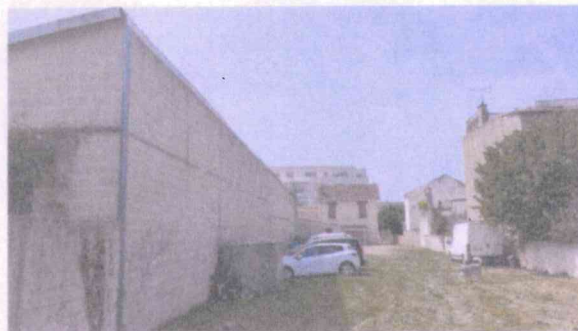
Vue local, de la parcelle AC 143