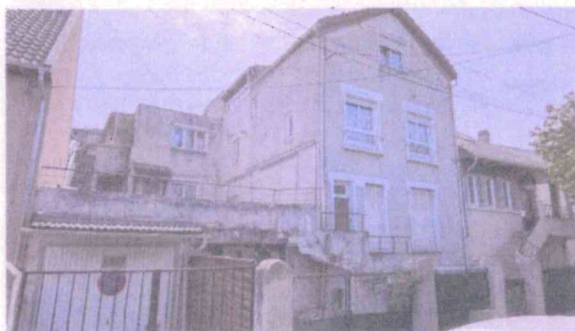
Vue Immeuble, de la rue de Saumur

Immeuble collectif 6 logements – R + 3 - hauteur : environ 10 Mètres