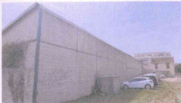
Vue local, de la parcelle AC 143

Local activité – hauteur : environ 7 Mètres