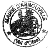
Pascal DOLL Maire

Mis en ligne et/ou notifié le : 19/03/2026 Acte rendu exécutoire le : 19/03/2026 conformément aux dispositions des articles L.2131-1 et L.2131-2 du Code général des collectivités territoriales